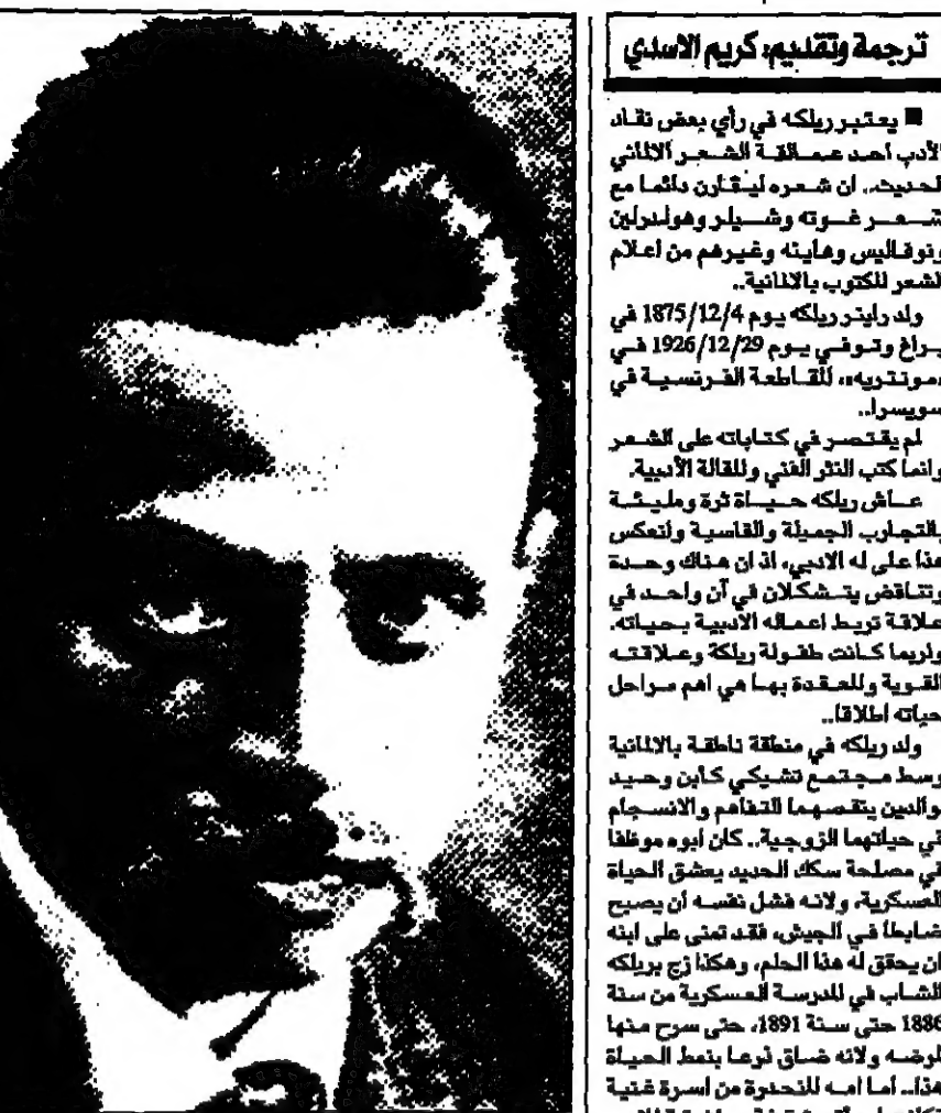
دايفر ماريا ريلكه